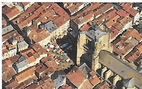
Villefranche de Rouergue: La Collégiale

Nous espérons que vous viendrez nombreux à Villefranche où le meilleur accueil vous attend